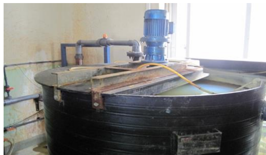
化学沉淀法处理设备