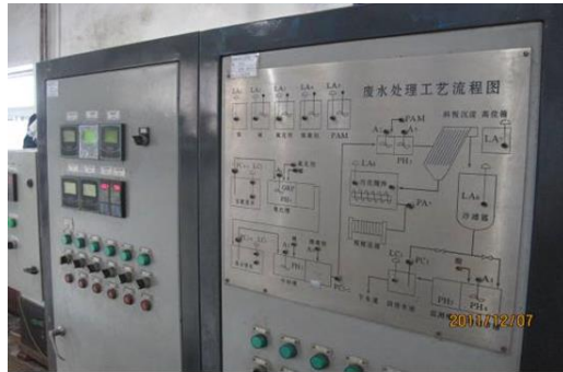
废水处理自动控制系统盘