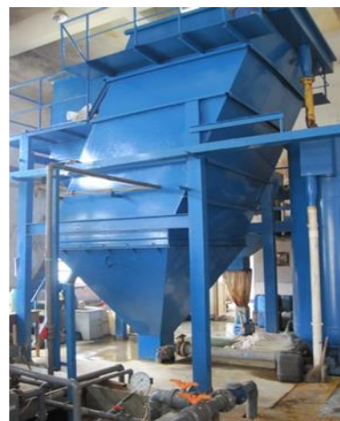
物理沉淀实现澄清水和污泥的分离斜板设施