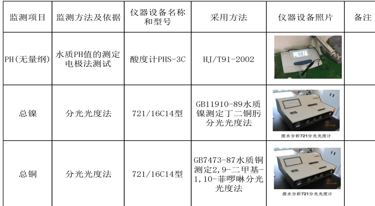
废水污染物自行监测方法及使用仪器设备一览表